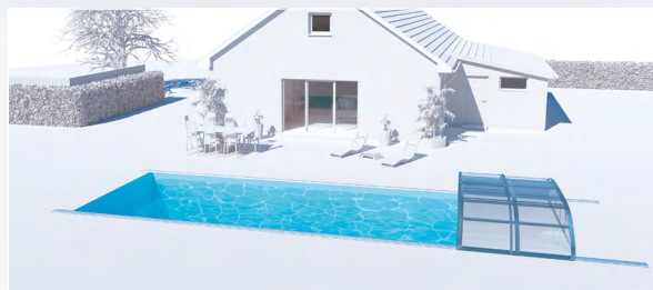
LES MODULES PEUVENT ÊTRE EMPILÉS AU-DELÀ DU BASSIN