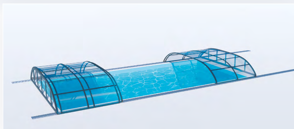
LES ÉLÉMENTS SONT ENTIÈREMENT INDÉPENDANTS

DISCRET, LE THERMO, POUR PROLONGER VOTRE TEMPS DE BAINNADE