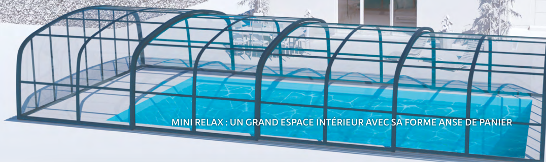
MINI RELAX : UN GRAND ESPACE INTÉRIEUR AVEC SA FORME ANSE DE PANIER