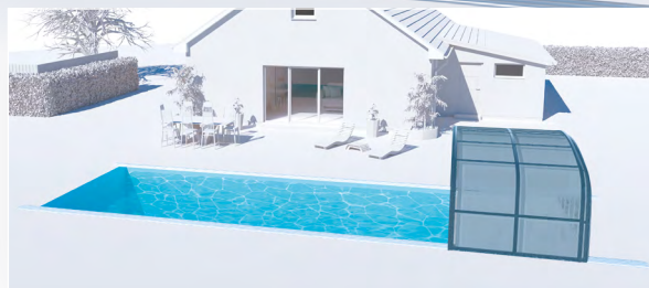
LES MODULES PEUVENT ÊTRE EMPILÉS AU-DELÀ DU BASSIN