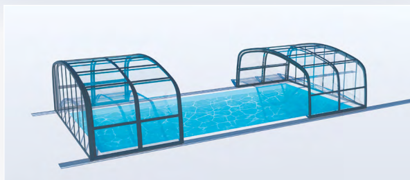
LES ÉLÉMENTS SONT ENTièrement INDÉPENDANTS